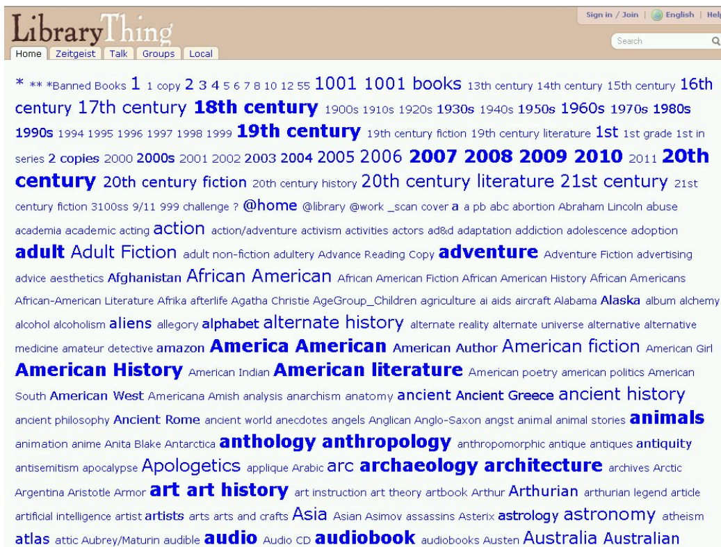
Afbeelding 1 - Begin van de tagcloud van de tags die zijn toegekend aan de 60 miljoen in Librarything beschreven boekexemplaren (alfabetisch geordend). ( http://www.librarything.com/tagcloud.php )

Bij het toekennen van tags zullen de meeste gewone gebruikers (uiteraard) niet op een dergelijke planmatige, systematische wijze te werk gaan. Toch zal iemand ook hierbij, veelal onbewust, een inhoudsanalyse maken van het object dat hij met tags wil karakteriseren. Het persoonlijke, veelal abstracte beeld dat hij zich van dat object heeft gevormd, zal hij vervolgens ook vertalen naar een aantal toe te kennen tags, of je dat nu een informatietaal wilt noemen of niet. Natuurlijk bestaat geen eenduidig beeld of iedere gebruiker zich bij deze stap volledig bewust zal zijn van de zoekster die dit object later moet kunnen terugvinden - of hij nu zelf die zoekster zal zijn, of dat juist anderen de doelgroep vormen. Daarbij zal men vrijwel altijd afzonderlijke tags toekennen voor de verschillende elementen en invalshoeken van de beschreven objecten, dus postcoördinatief te werk gaan. Daarnaast spelen begrippen als indexeerdiepte en globale of diepte-indexering bij tagging dus ook wel degelijk een rol.