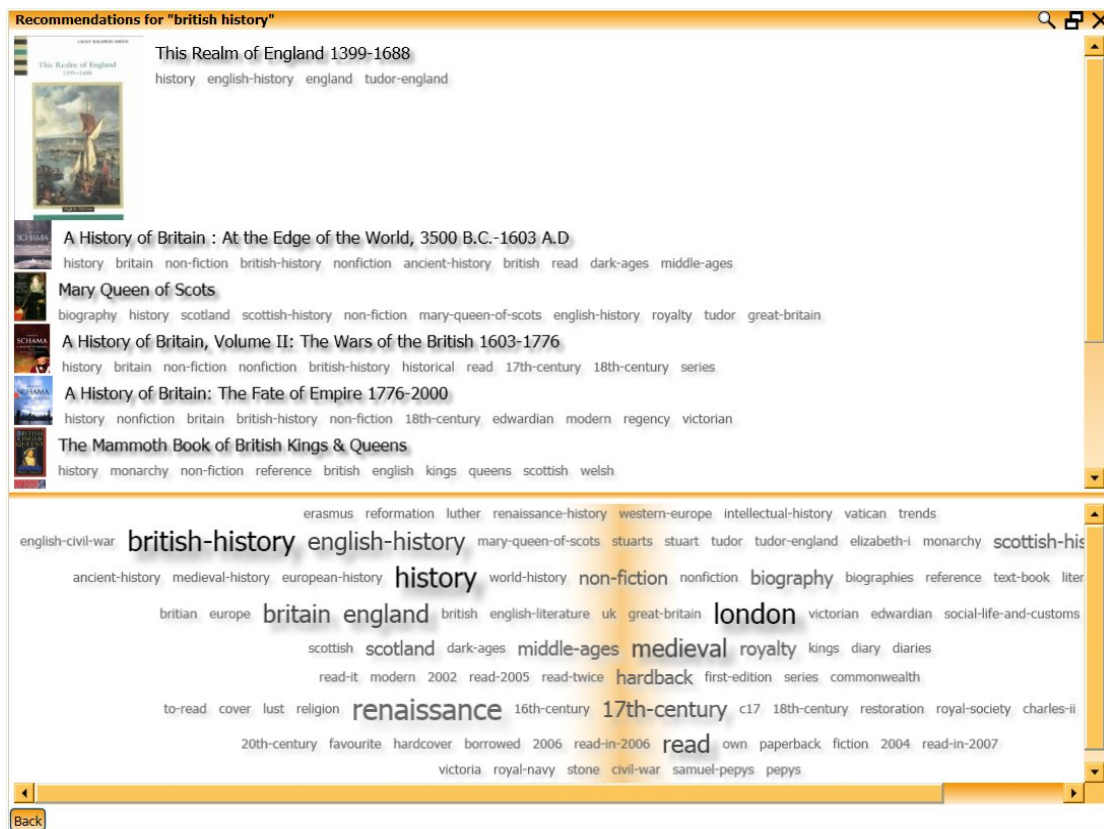
Afbeelding 5 - Zoekresultaten en tag cloud voor een zoekvraag naar "british history", in een data sample van LibraryThing. Deze wolk is op dezelfde manier gegenereerd als die in afbeelding 4. Merk op dat de gezochte tag niet voorkomt bij het eerste zoekresultaat. (Wartena, 2010).