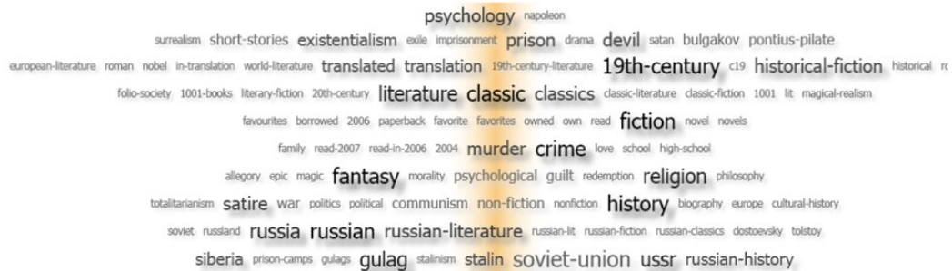
Afbeelding 4 - Semantisch geordende tagcloud uit LibraryThing. Selectie van tags waarvan op basis van statistiek is afgeleid dat ze gerelateerd zijn aan de tag 'russian literature'. De clustering van termen per regel is gebaseerd op co-occurrence analyse. De volgorde van de regels en van de tags op elke regel is zodanig dat sterk overeenkomende tags zo dicht mogelijk bij elkaar staan. Door de plaatsing van de tag "c19" naast "19th-century" wordt meteen duidelijk wat deze tag betekent. (Wartena, 2010).

Onderzoek aan tagging beperkte zich aanvankelijk vooral tot kwaliteitsanalyses: in hoeverre eenduidige termen worden gebruikt, in hoeverre er problemen zijn met synonymie, in hoeverre de tags vooral zijn bedoeld voor persoonlijk (her)gebruik en niet gericht op publiekelijke bruikbaarheid, wat de specificiteit van toegekende tags is, voor welke soorten eigenschappen tags zijn toegekend, of voldoende tags zijn gebruikt om alle aspecten van een document, een foto of een video te beschrijven - dus wat de indexeerdiepte is - enzovoort (Macgregor, 2006; Golder, 2006; Chung, 2009). Vaak leidt dat tot de conclusie dat tagging meer een aanvulling is op klassieke ontsluiting, dan een vervanging daarvan (Guy, 2006). Ook wordt wel gekeken naar de verdeling van de frequentie van toekenning van tags. Die blijkt meestal een soort Zipf-verdeling te volgen: een beperkt aantal zeer veel gebruikte tags en een lange staart ( long tail ) van heel weinig of misschien zelfs maar eenmalig toegekende tags (Peters, 2009).